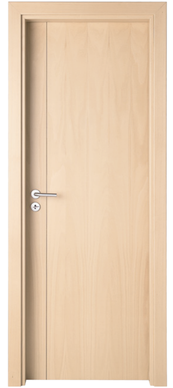
MMA0601 PTX Fala