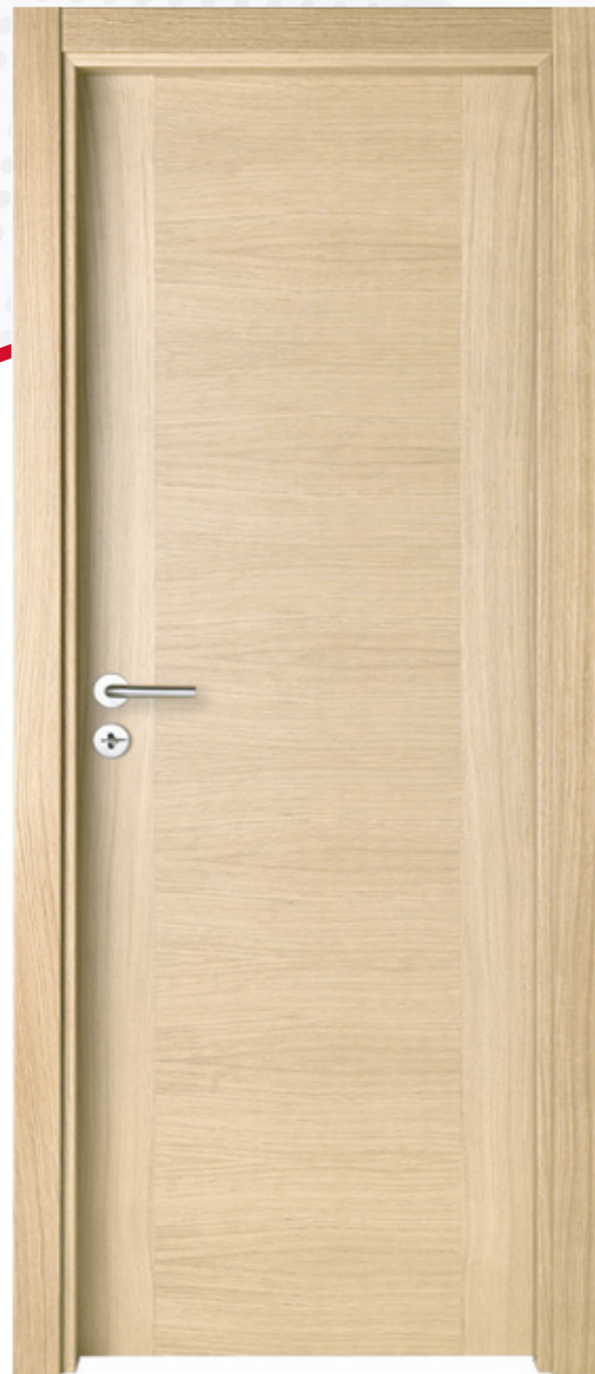
MMA0501 PTX Carvalho