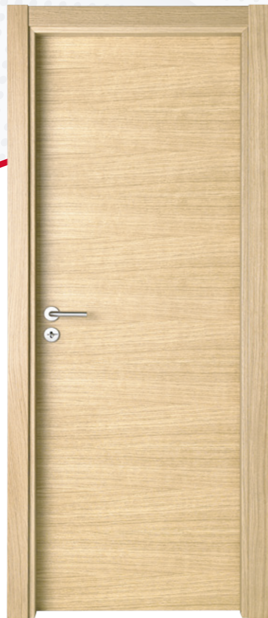
MMA0701 PTX Carvalho