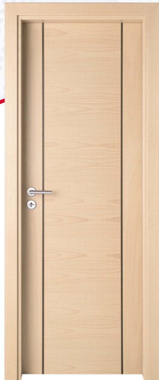
MMA0301 PTX Faia