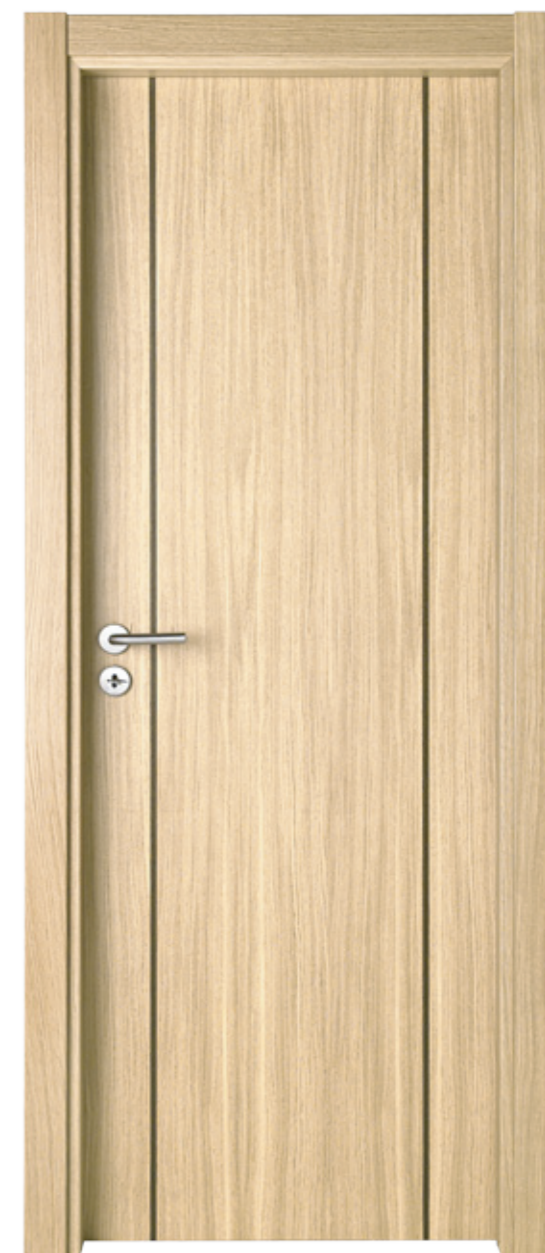
MMA0201 PTX Carvalho